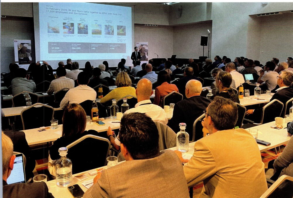
Im September trifft sich die Branche zur Decorative Surfaces Conference im Mariott-Hotel Hamburg