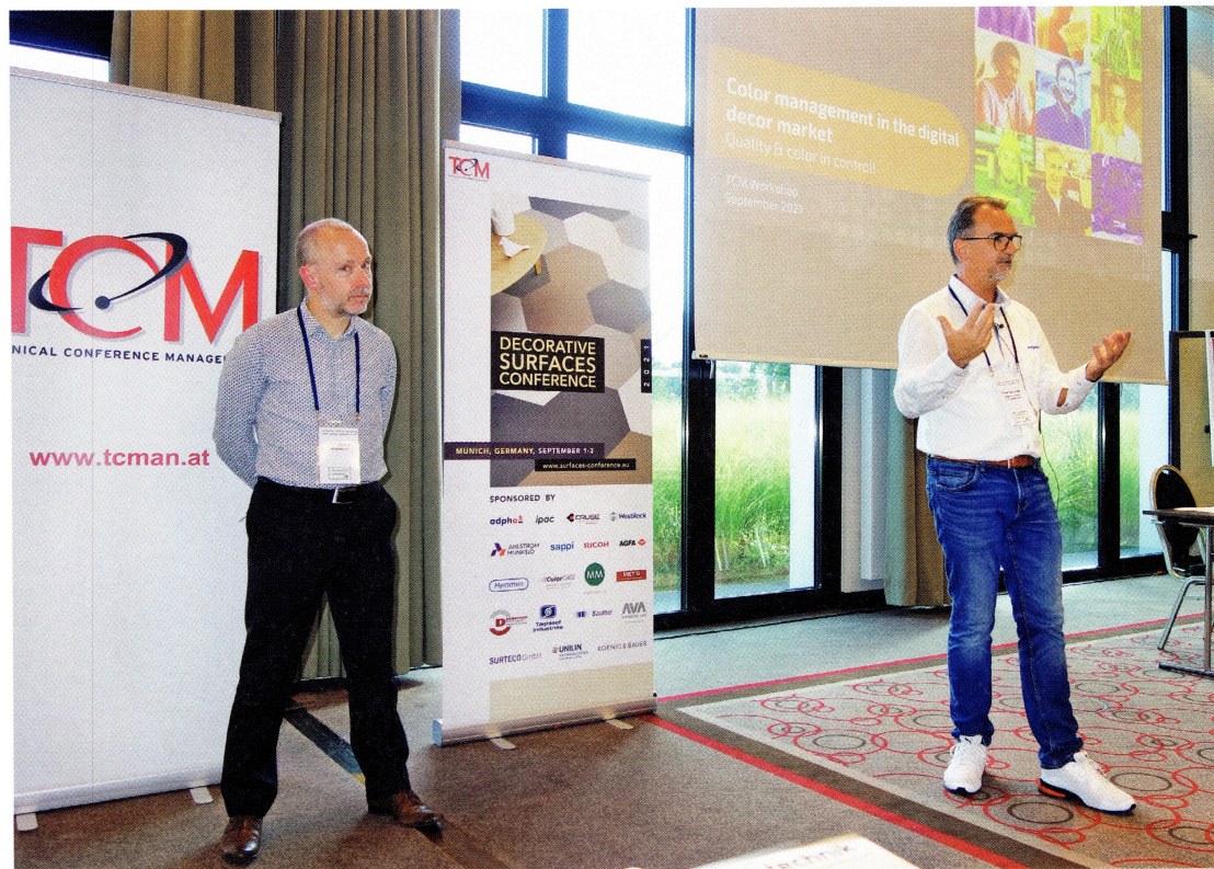
Am Vortag wird im Rahmen eines Workshops der komplette digitale Druckprozess beleuchtet. The day before, the entire digital printing process will be examined in a workshop.

Dr Kurt Fischer has chosen Leipzig as the conference venue this year.